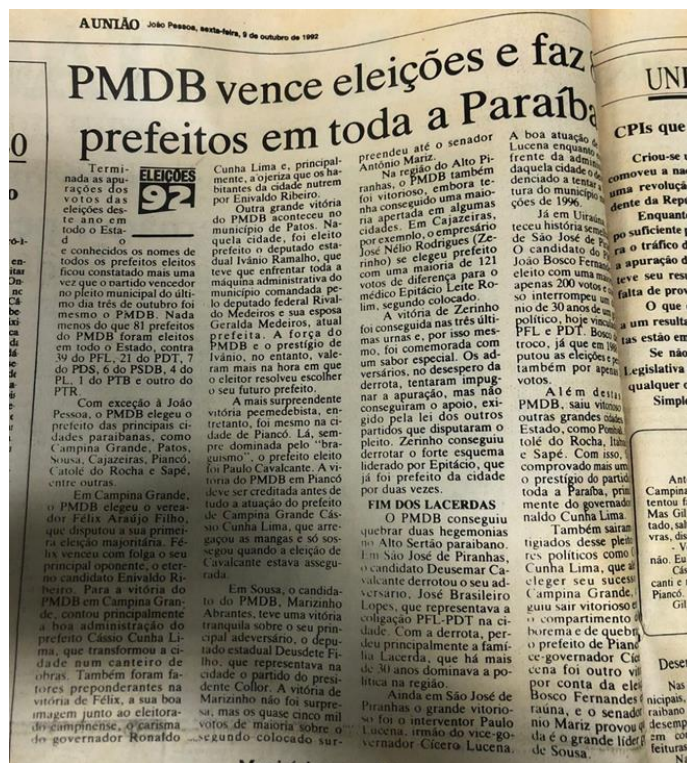
Imagem 1: “PMDB vence eleições e faz 81 prefeitos em toda a Paraíba”