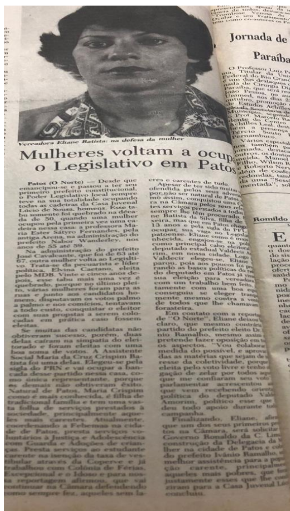
Imagem 6: “Mulheres voltam a ocupar o Legislativo em Patos”