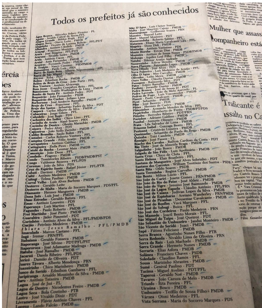
Imagem 5: “Todos os prefeitos já são conhecidos”